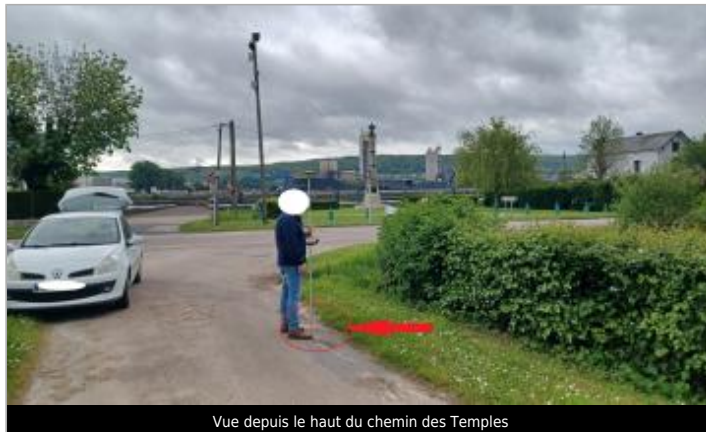
Vue depuis le haut du chemin des Temples