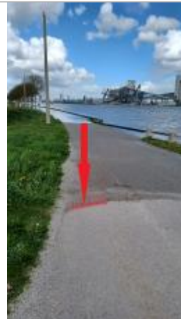
vue depuis le virage de la route des prés d'Hautot