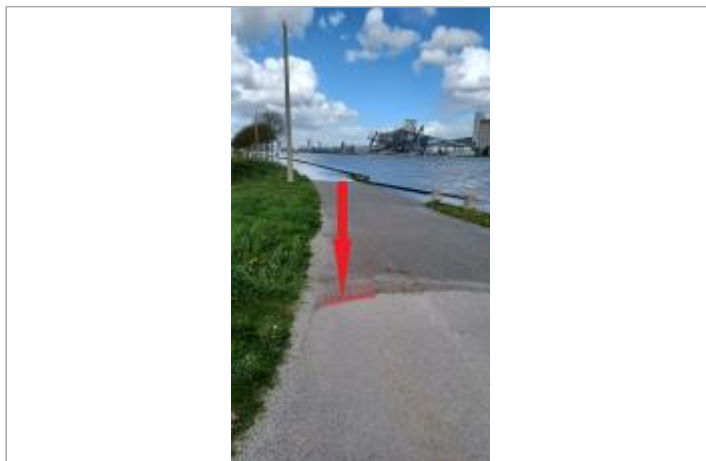
vue depuis le virage de la route des prés d'Hautot