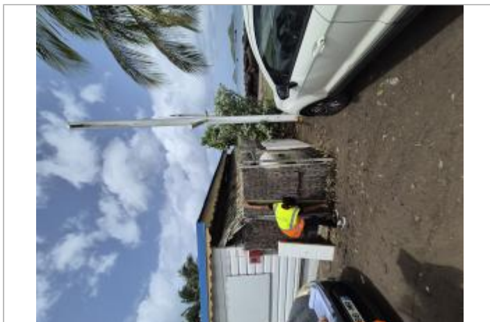
Vue façade côté route