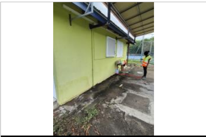
Limite de la zone inondée

GÉOLOCALISATION Coordonnées WGS84 : X: -61.76700250 / Y: 16.08376030 (RRAF 91)UTM 20N X: 631873.92 / Y: 1778593.66 Coordonnées RGF93 (ETRS89) : X: -61.7670025 / Y: 16.0837603