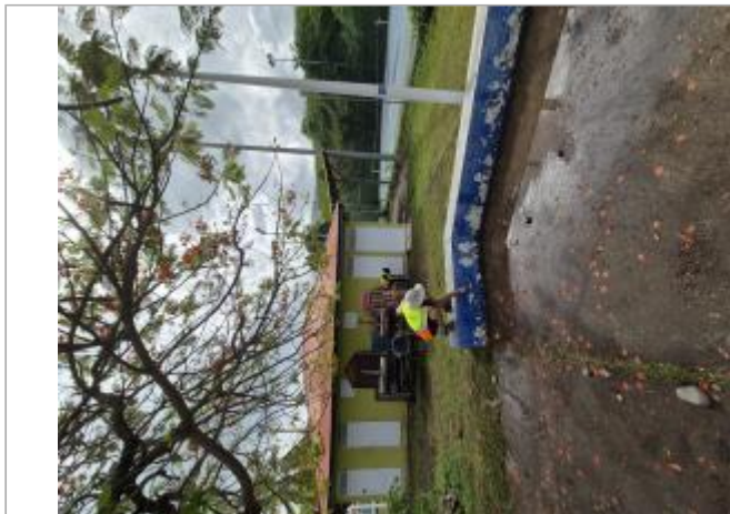
Trace sur bâti vert à proximité du terrain de tennis