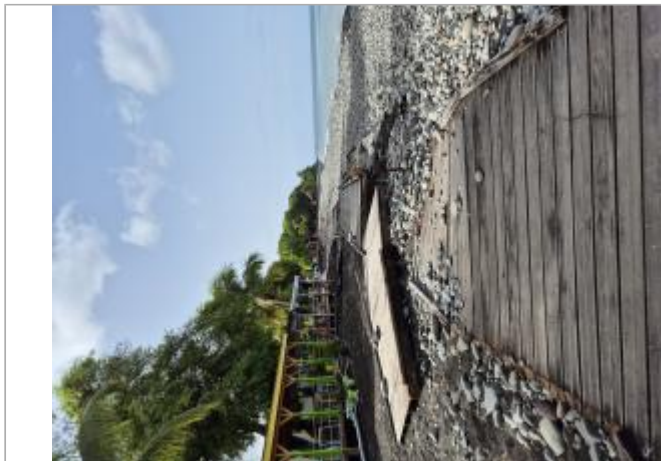
Destruction du ponton piéton en bois