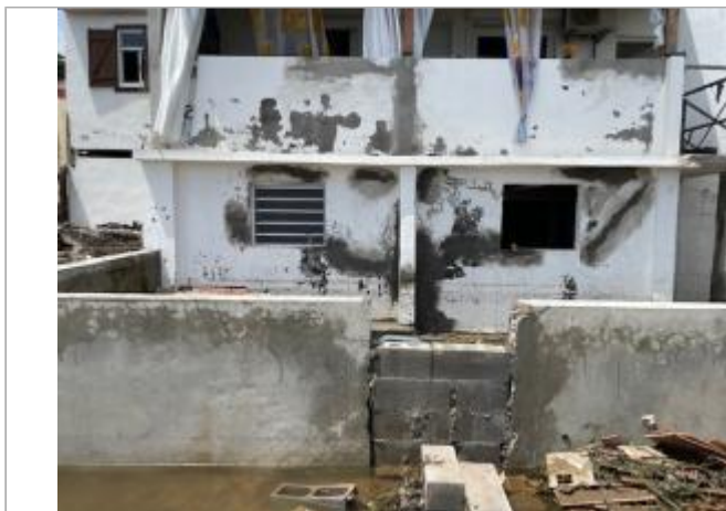
dépôt de matière solide sur le mur façade littorale