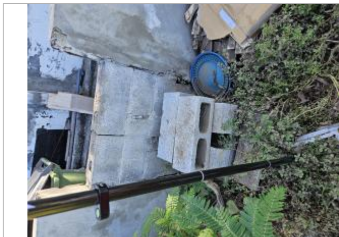
Image prise pendant le nivellement