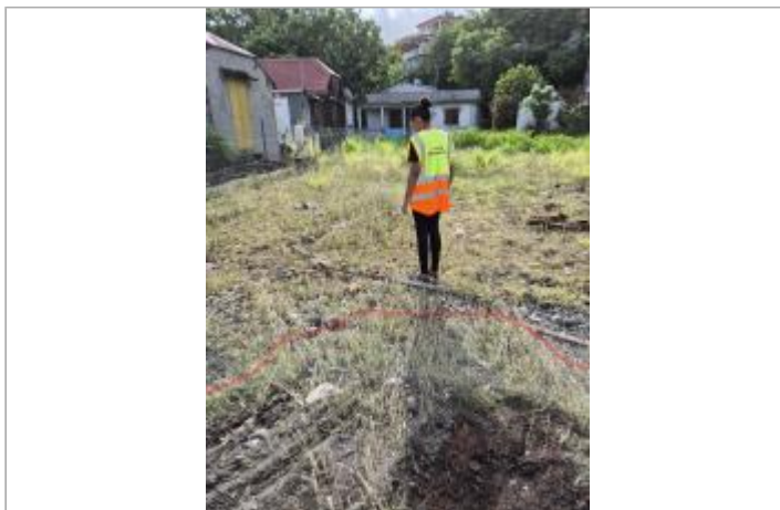
Emprise de zone inondée sur terrain en friche