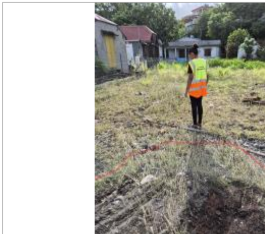
Emprise de zone inondée sur terrain en friche

Coordonnées WGS84 : X: -61.74677290 / Y: 16.01782220