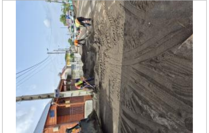
Dépôts considérables de sable sur la RN2