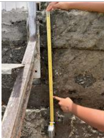
A droite de l'escalier (quand on est face à lui)

Altitude calculée de l'eau (en m) : 3.505