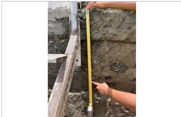
A droite de l'escalier (quand on est face à lui)