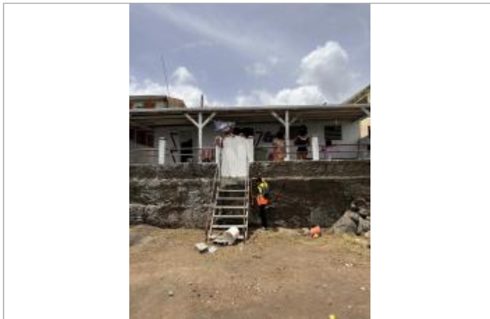
Bâti façade littorale avec escalier en métal