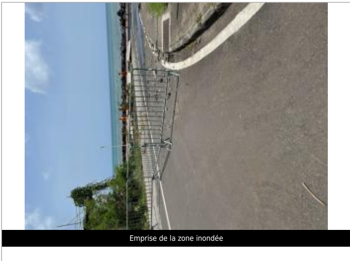
Emprise de la zone inondée