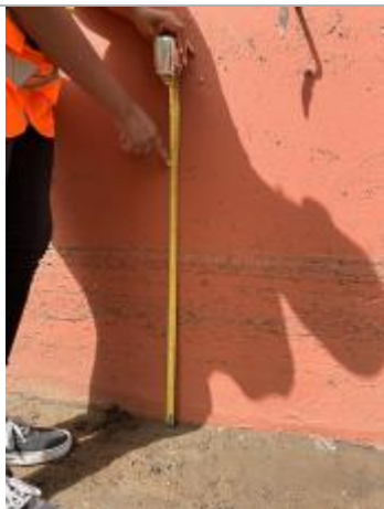
dépot de matière solide sur le mur

Altitude calculée de l'eau (en m) : 3.373