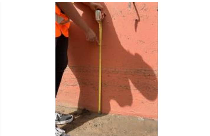
dépot de matière solide sur le mur

SOURCE DE REPÉRAGE : CAMPAGNE TERRAIN POST-INONDATION BÉRYL (02/07/2024) -