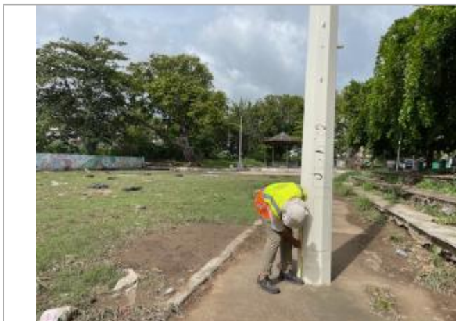
Luminaire stade de foot