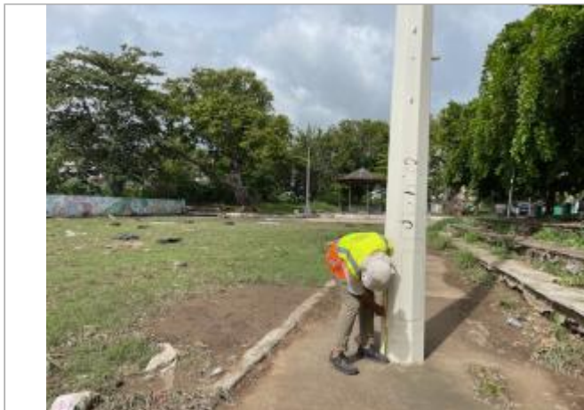
Luminaire stade de foot