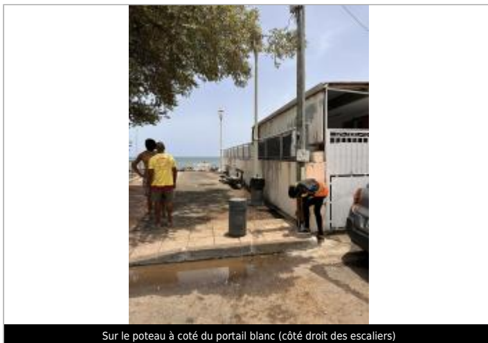
Sur le poteau à côté du portail blanc (côté droit des escaliers)