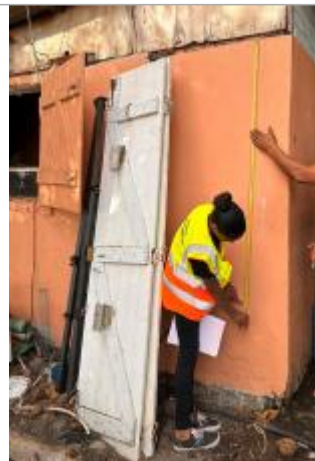
Mur de la maison façade littorale

Coordonnées RGF93 (ETRS89) : X: -61.7466749 / Y: 16.0135147