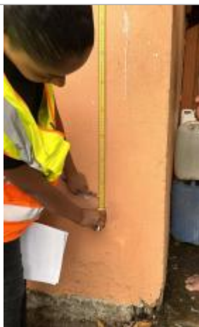
Mur de la maison façade littorale

Altitude calculée de l'eau (en m) : 4.015 m