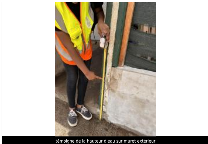
témoigne de la hauteur d'eau sur muret extérieur