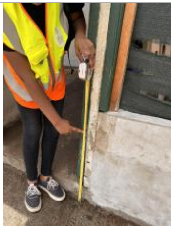
témoigne de la hauteur d'eau sur muret extérieur