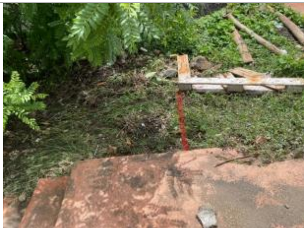
Aplatissement de la végétation

Altitude calculée de l'eau (en m) : 4.344 m