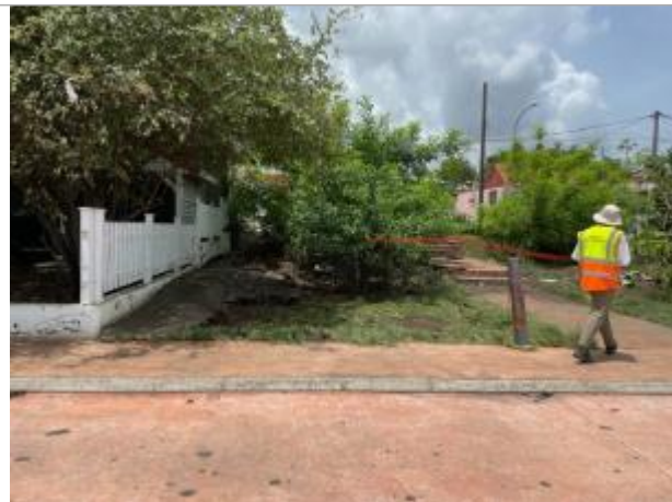
Limite de l'emprise inondée en haut de l'escalier