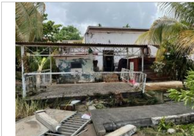
Bâti façade côté littoral