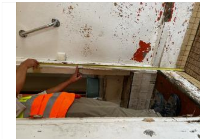
Témoignage hauteur atteinte par l'eau