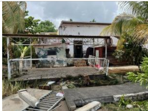
Bâti façade côté littoral