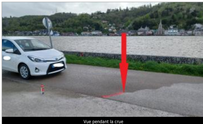
Vue pendant la crue

Coordonnées WGS84 : X: 0.93314511 / Y: 49.35438110