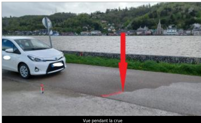
Vue pendant la crue