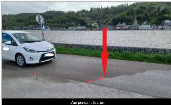
Vue pendant la crue