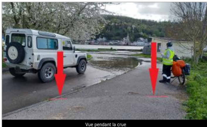
Vue pendant la crue