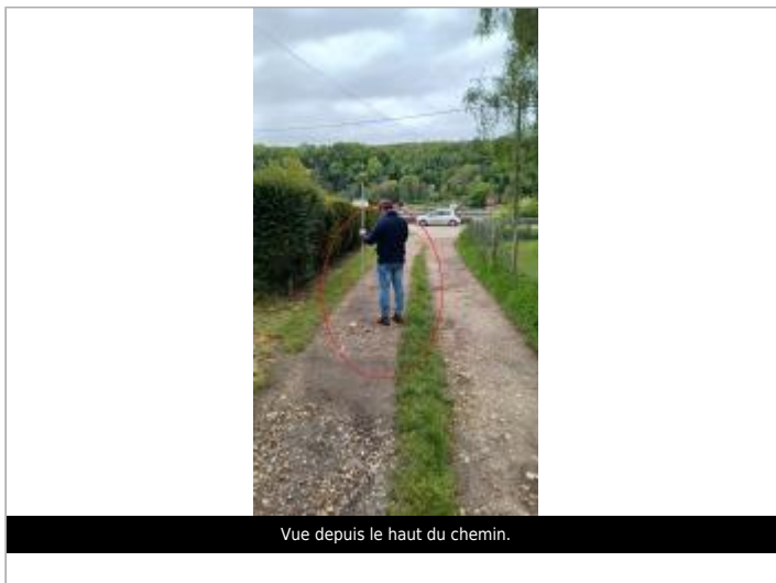
Vue depuis le haut du chemin.