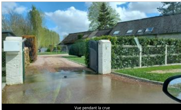
Vue pendant la crue