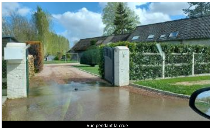
Vue pendant la crue