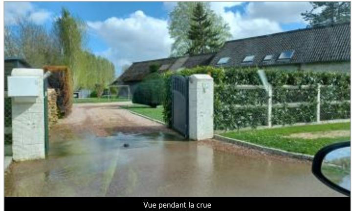
Vue pendant la crue

Coordonnées WGS84 : X: 0.91973648 / Y: 49.38403430