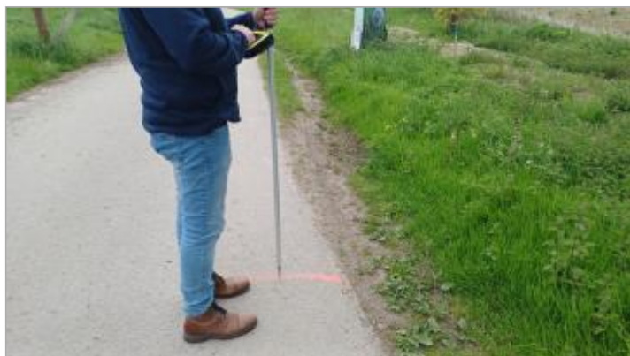
Laisse de crue au sol sur la gauche de la chaussée (face à La Seine)