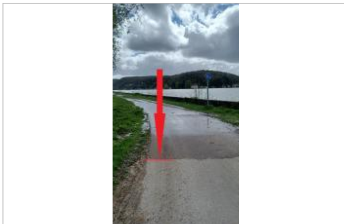
Vue depuis le côté du chemin du Marais

Coordonnées WGS84 : X: 0.92064477 / Y: 49.38748460