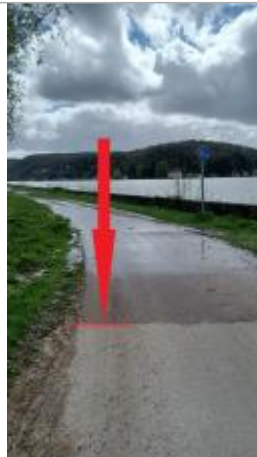
Vue depuis le côté du chemin du Marais