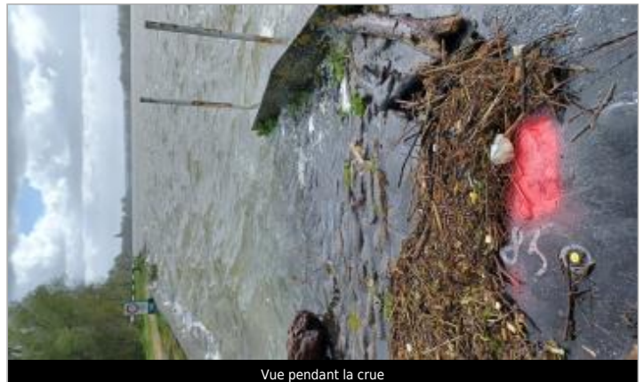
Vue pendant la crue

Coordonnées WGS84 : X: 0.93935461 / Y: 49.42662600