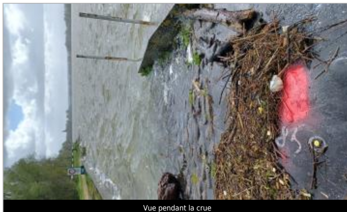
Vue pendant la crue