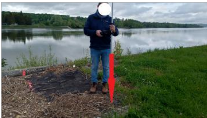
Laisse de crue au sol en haut de la mise à l'eau