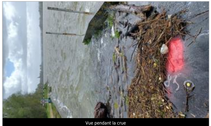
Vue pendant la crue

Coordonnées WGS84 : X: 0.93935461 / Y: 49.42662600