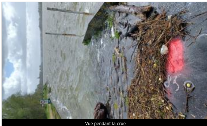
Vue pendant la crue