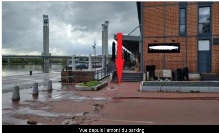
Vue depuis l'amont du parking