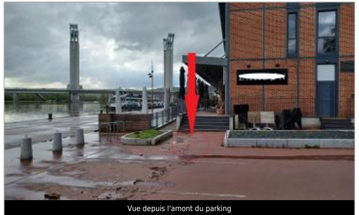
Vue depuis l'amont du parking

Coordonnées WGS84 : X: 1.06836420 / Y: 49.44430530