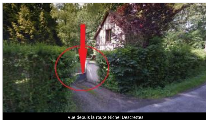
Vue depuis la route Michel Descrètes

GÉOLOCALISATION Coordonnées WGS84 : X: 0.18766076 / Y: 49.09636660 Coordonnées RGF93 (Lambert 93) X: 494641.23 / Y: 6892161.53 Coordonnées RGF93 (ETRS89) : X: 0.1876608 / Y: 49.0963666 Code Hydro: I0-0200 Rive de référence: Gauche