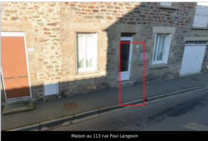
Maison au 113 rue Paul Langevin

GÉOLOCALISATION Coordonnées WGS84 : X: -2.50643241 / Y: 48.47260890 Coordonnées RGF93 (Lambert 93) X: 293325.2 / Y: 6833334.89 Coordonnées RGF93 (ETRS89) : X: -2.5064324 / Y: 48.4726089 Code Hydro: J13-0300 Rive de référence: Droite