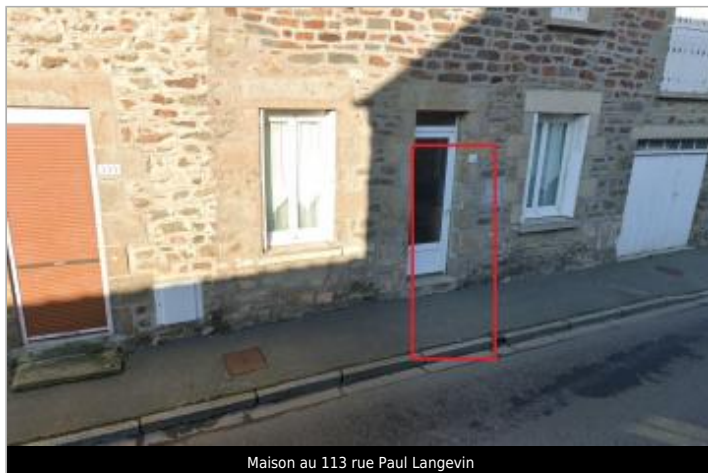
Maison au 113 rue Paul Langevin

Coordonnées WGS84 : X: -2.50643241 / Y: 48.47260890