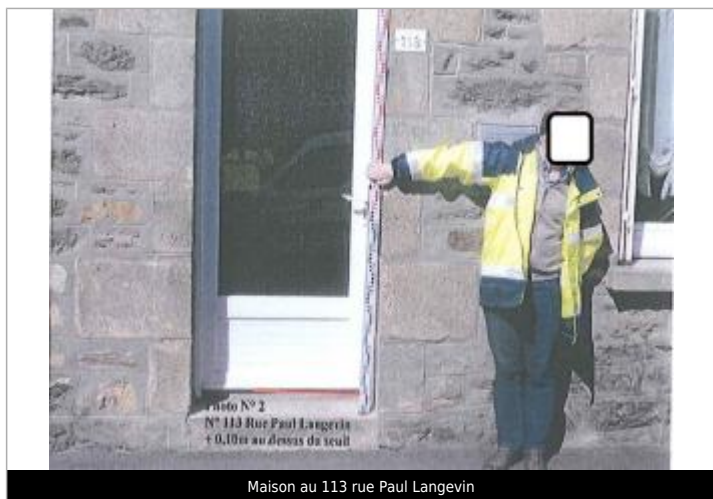
Maison au 113 rue Paul Langevin