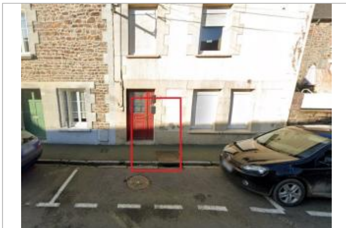
Maison au 83 rue Paul Langevin

GÉOLOCALISATION Coordonnées WGS84 : X: -2.50818865 / Y: 48.47243270 Coordonnées RGF93 (Lambert 93) X: 293194.34 / Y: 6833324.39 Coordonnées RGF93 (ETRS89) : X: -2.5081887 / Y: 48.4724327 Code Hydro: J13-0300 Rive de référence: