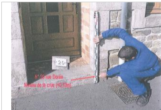
Porte d'entrée de la maison au 20 rue Doré

Différence entre le niveau d'eau et la référence (en m) : 0.130 m