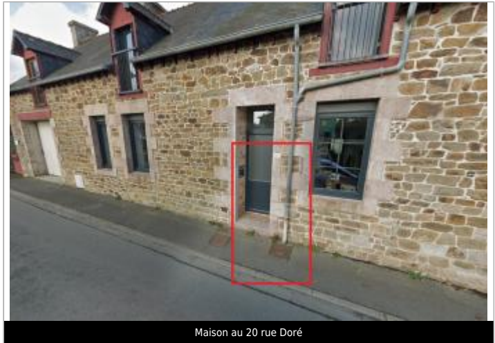
Maison au 20 rue Doré