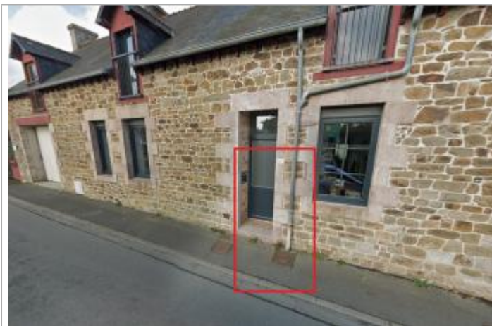
Maison au 20 rue Doré

Coordonnées WGS84 : X: -2.52209095 / Y: 48.47223940