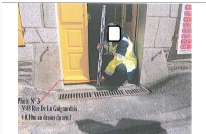
Porte d'entrée de la maison au 48 rue de la Guignardais

Différence entre le niveau d'eau et la référence (en m) : 0.100 m