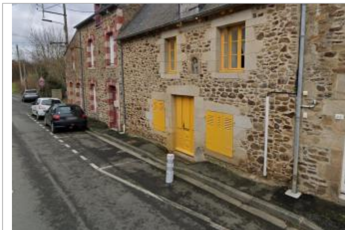
Maison au 48 rue de la Guignardais

Coordonnées WGS84 : X: -2.51680570 / Y: 48.47512880