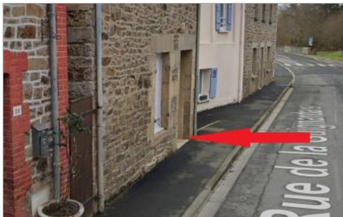
Maison au 41 rue de la Guignardais

Coordonnées WGS84 : X: -2.51700017 / Y: 48.47517220