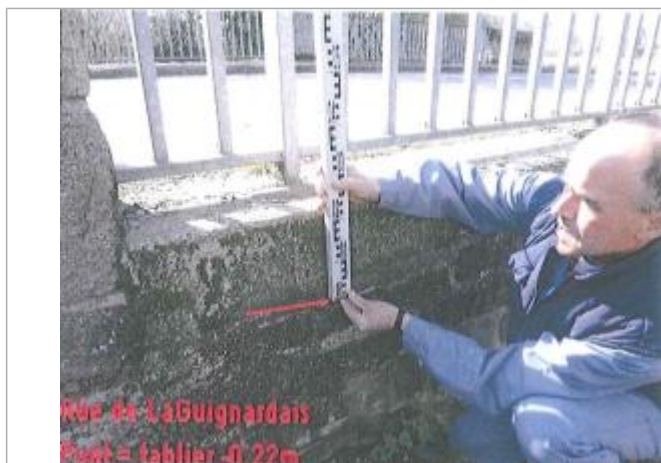
Tablier du pont sur le Chifrouet rue de la Guignardais