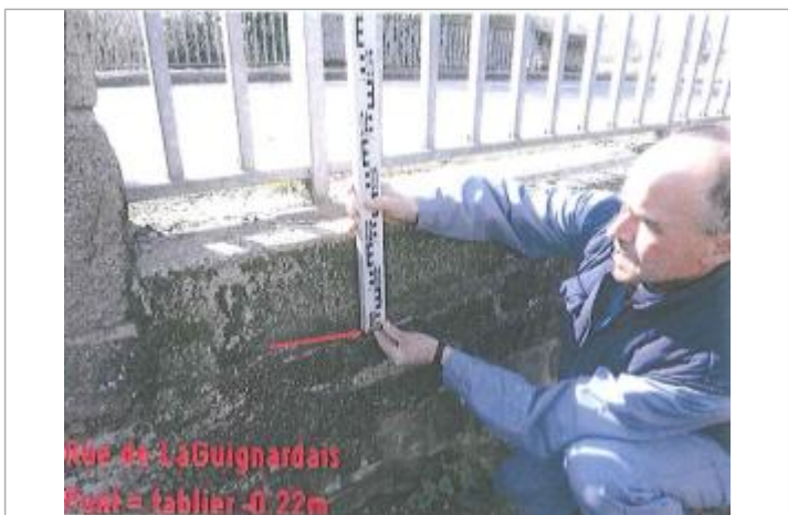
Tablier du pont sur le Chifrouet rue de la Guignardais

GÉNÉRAL Code : SPC_22093_027_2010 Date de mise à jour : 09/03/2026 Auteur : SPC VCB