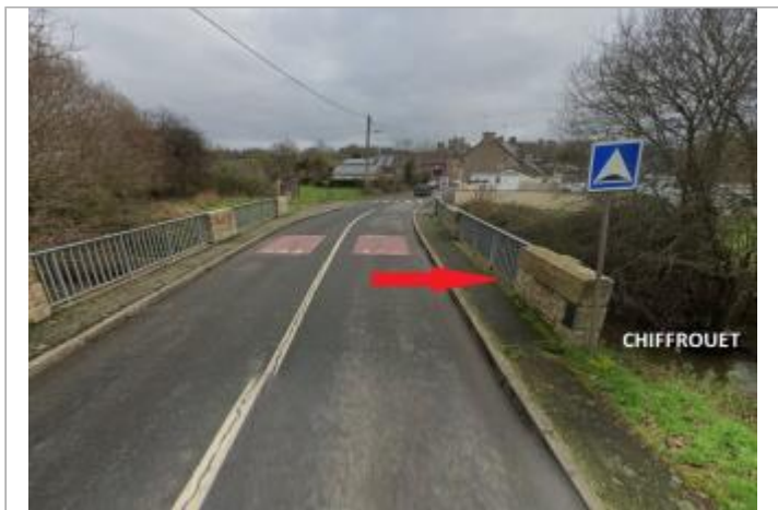
Pont sur le Chifrouet rue de la Guignardais

GÉOLOCALISATION Coordonnées WGS84 : X: -2.50433136 / Y: 48.48172440 Coordonnées RGF93 (Lambert 93) X: 293550.7 / Y: 6834334.88 Coordonnées RGF93 (ETRS89) : X: -2.5043314 / Y: 48.4817244 Code Hydro: J1314600 Rive de référence: Gauche