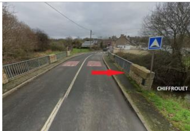
Pont sur le Chifrouet rue de la Guignardais

Coordonnées WGS84 : X: -2.50433136 / Y: 48.48172440