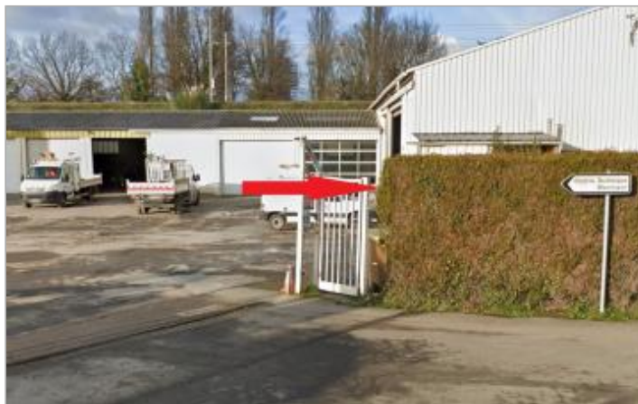
Centre technique municipal