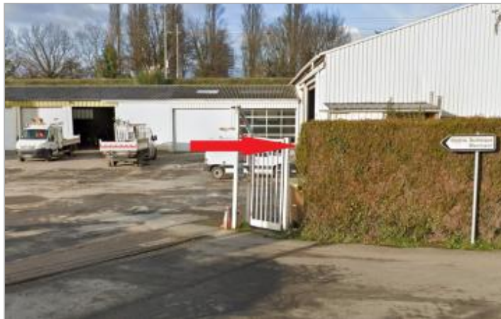
Centre technique municipal