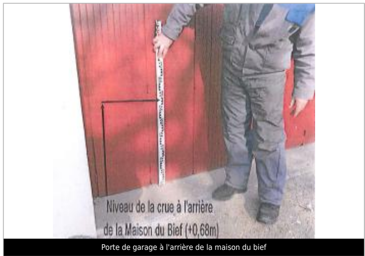
Niveau de la crue à l'arrière de la Maison du Bief (+0,68m)