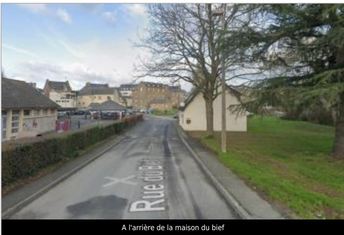
A l'arrière de la maison du bief