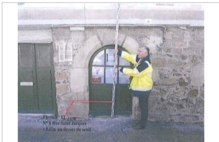
seuil porte d'entrée au 8 rue Saint-Jacques

Différence entre le niveau d'eau et la référence (en m) : 0.420 m