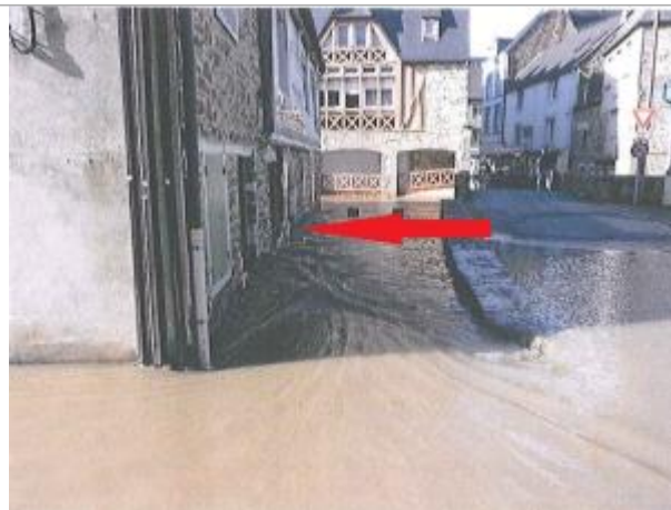
seuil porte d'entrée au 8 rue Saint-Jacques

Coordonnées WGS84 : X: -2.51463904 / Y: 48.46844040