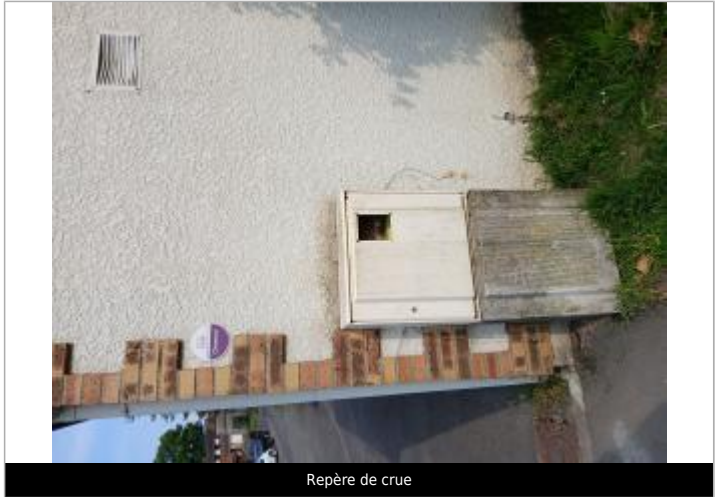
Repère de crue