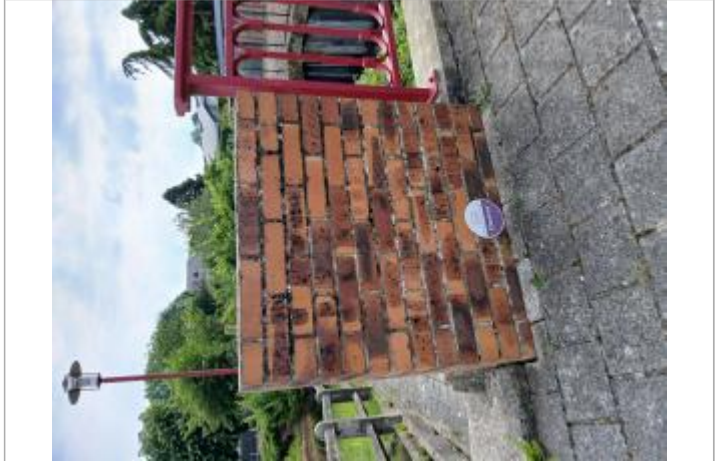
Photo de repère