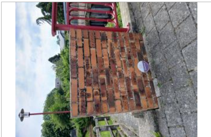
Photo de repère

MARQUE Texte : Niveau atteint par les eaux Clarence Visibilité : Oui