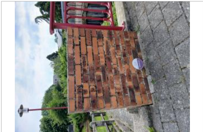
Photo de repère

GÉNÉRAL Code : WEB_R_202406282212 Date de mise à jour : 28/06/2024 Auteur : SYMSAGEL