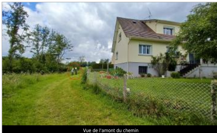
Vue de l'amont du chemin