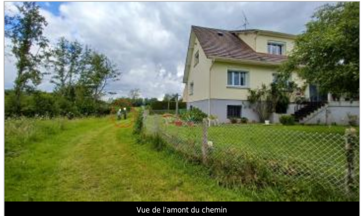
Vue de l'amont du chemin

Coordonnées WGS84 : X: 0.21560113 / Y: 49.11365830