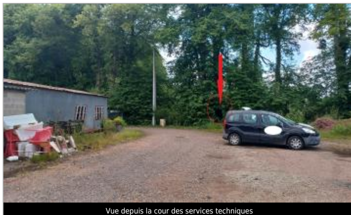
Vue depuis la cour des services techniques