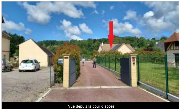
Vue depuis la cour d'accès