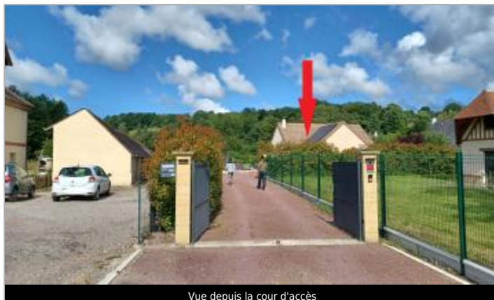
Vue depuis la cour d'accès