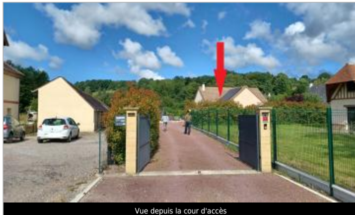
Vue depuis la cour d'accès